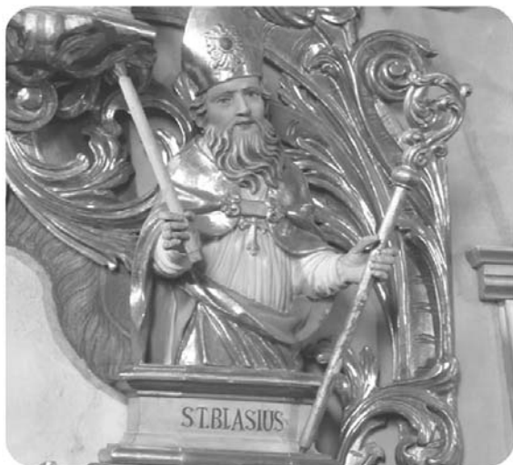
Pfarrkirche Niederolang, Foto: Peter Kane

Der heilige Blasius (Festtag: 3. Februar) war ein Bischof, der auch in schweren Zeiten Gott die Treue hielt und Menschen aus ihrer Not errettet hat. Mit dem Blasiussegen hoffen wir, dass auch wir in Notzeiten Licht sehen. Licht, das uns daran erinnert, dass wir auch dann im Licht Jesu sind, wenn wir krank werden oder Sorgen haben.