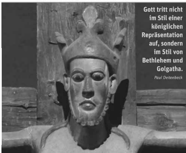
Stiftskirche zu den Heiligen Candidus und Korbinian, Innichen

Gott tritt nicht im Stil einer königlichen Repräsentation auf, sondern im Stil von Bethlehem und Golgatha.