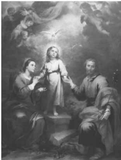
Bartolomé Esteban Murillo, Die himmlische und irdische Trinität (1675-82)

In der irdischen Trinität von Maria, Josef und Jesus - und in jeder Beziehung, die von Liebe geprägt ist - spiegelt sich die göttliche Trinität von Vater, Sohn und Heiliger Geist. Denn Trinität bedeutet Liebe. Göttliche Liebe, die durch die Menschwerdung in Jesus und im Beistand des Geistes menschlich geworden ist.