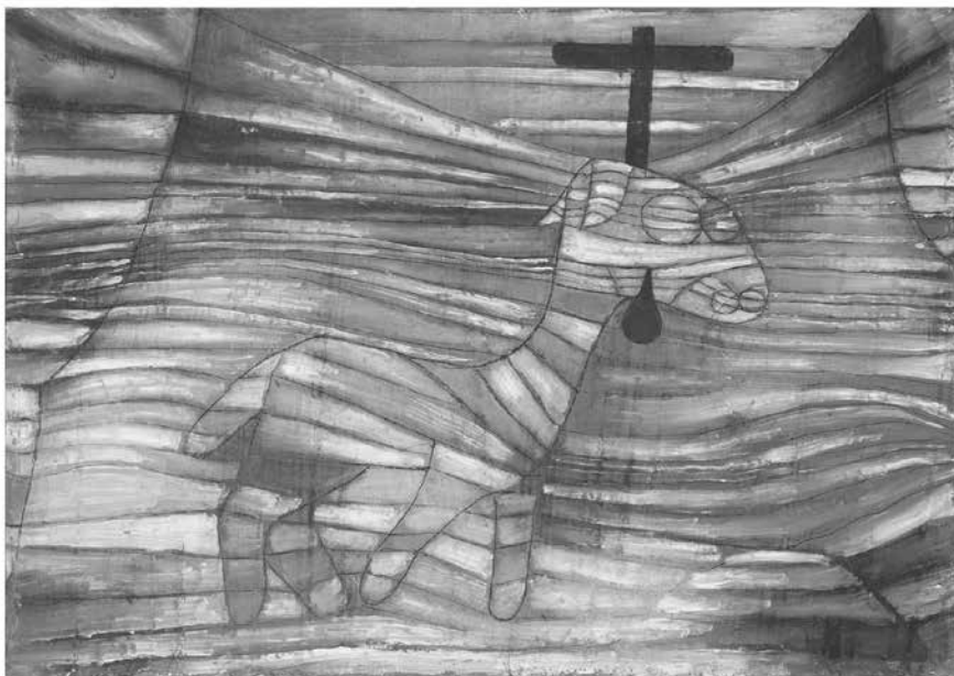
Paul Klee, Das Lamm, 1920, Städel Museum, Frankfurt am Main

D as Lamm steht als Symbol für die Unschuld. Es war zugleich ein klassisches Opfertier, nicht nur im Judentum, sondern auch im griechischen und römischen Glauben, wenn Tieropfer praktiziert wurden. Jesus Christus hat sich am Kreuz als ein solches Opferlamm offenbart.