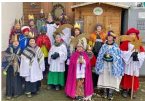
Sternsinger Hülscotten und Sternsinger Heggen

Am 02. Feb. werden nach dem Hochamt frische Waffeln und warme Getränke angeboten. Spenden für die caritativen Aufgaben vor Ort sind willkommen. Vorschau: Am 27. Mai bietet die Caritas eine Fahrt nach Werl zur Muttergottes an. Weitere Infos folgen!